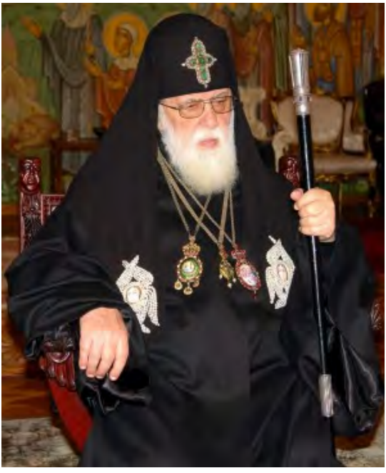
სრულიად საქართველოს კათოლიკოს-პატრიარქის ილია II-ის საშობაო ეპისტოლე

ყოვლადსამღვდელონო მღვდელმთავარნო, ღირსნო მოძღვარნო, დიაკონნო, ბერ-მონაზონნო, ხელისუფალნო, საქართველოს წმინდა მართლმადიდებელი ეკლესიის ყოველნო წევრნო, მკვიდრნო ივერიისა და ჩვენი ქვეყნის საზღვრებს გარეთ მცხოვრებნო თანამემამულენო: