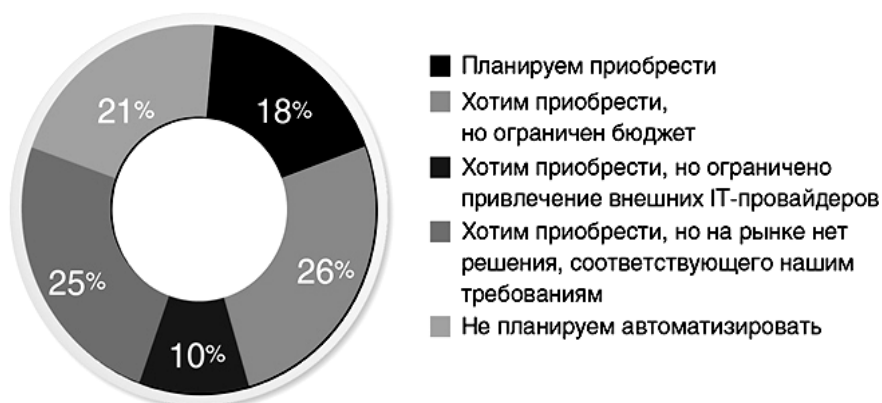
Рис. 3. Какие планы у юридических департаментов по приобретению решений legaltech?