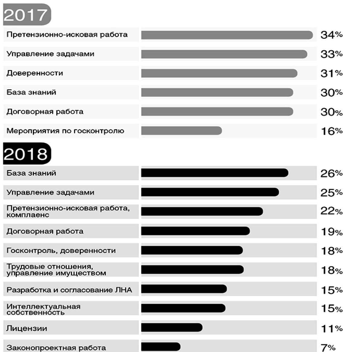
Рис. 2. Какие юридические процессы планируется автоматизировать в российских компаниях?