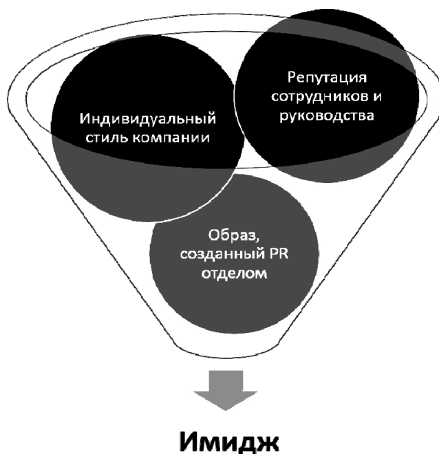
Рис. 1. Компоненты имиджа (составлен автором)

Внутренний имидж — это то, как персонал представляет свою компанию, это отношения внутри коллектива и к самой организации. К главным показателям внутреннего имиджа причисляют корпоративную этику, традиции, корпоративную культуру и правила, прописанные в Уставе.