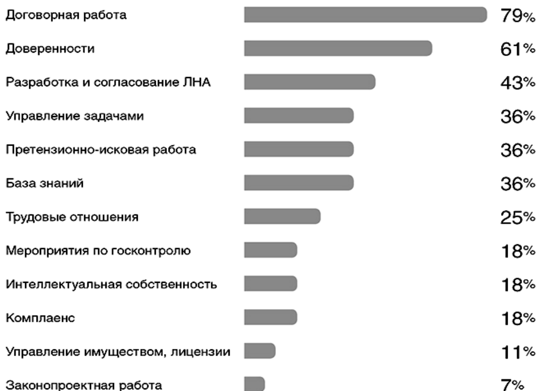
Рис. 1. Какие юридические процессы автоматизированы в российских компаниях?

были опрошены 70 компаний с различной численностью работников. Согласно этому исследованию, наиболее автоматизированными процессами в юридической компании стала договорная работа и согласование документов (рис. 1).