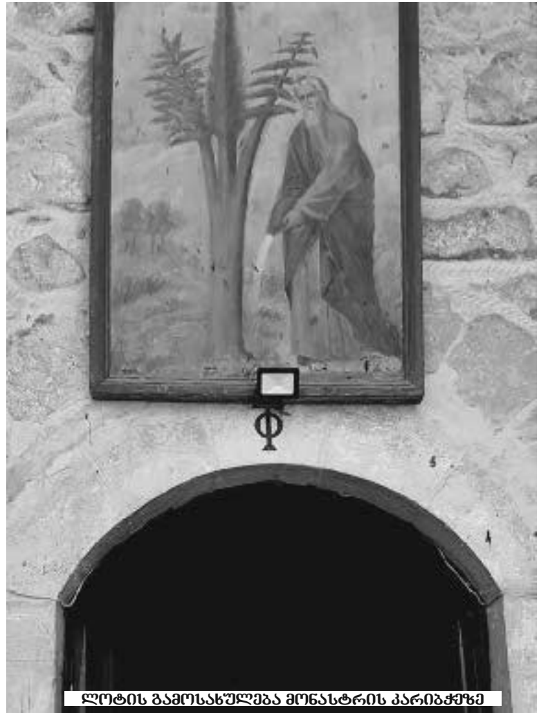
ლოტის გამოსახელება მონასტრის კარიბჭეში

რეს, ოქროს ან სულაც თამარ მეფის ნეშტს ეძებდნენ, იმიტომაც არის ამოთხრილი კედლებიან-იატაკიანად, — მეუბნება ერთი ყმაწვილი.