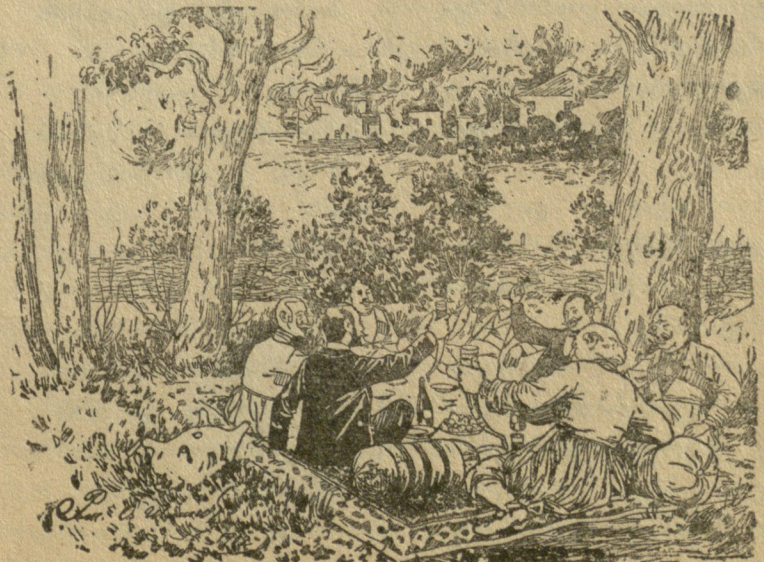
— ღმერთმა გაუმარჯოს იმ კაცს, ვინც ალალ-მართალი შრომით სკამს ლუკმა პურს.