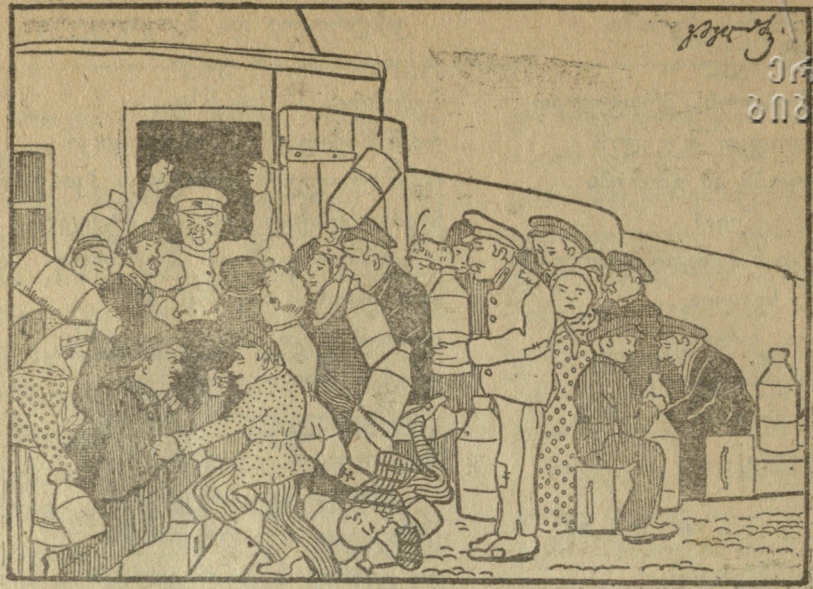
ნავთის დარიგება რკინის გზის სამმართველოს ეზოში.

გუშინდელი ფეხ-ადგმული ნუ თუ მართლა გახდა ბრძენი?