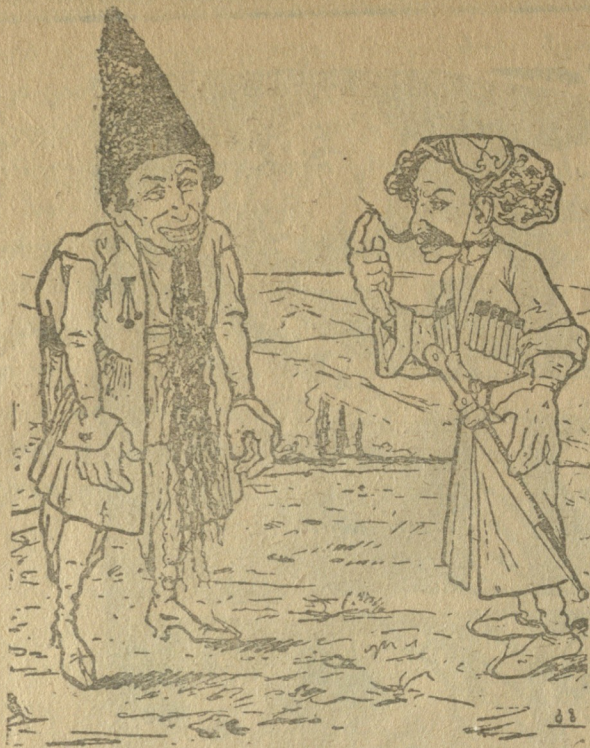
ბენია და ბეშტია.

ეხლა სოფლად ცხოვრება მეტად გასაჭირია, ალარ იცი რა მოგკლავს სად რომელი ჭირია. ექიმი რომ იშოვო მიყვანა არ გჭირია? ოცი თუმანი ფასობს ცხენია თუ ვირია. ჩვენი აფთიაქრებიც სულმთლად გადიარია, ორი რეცეპტი მქონდა სხვა და სხვანაირია, მაგრამ თურმე წამალი იმოდენა ძვირია, როცა ფასი გავიგე, ავაბზუფე ცხვირია. ლამის იქ დავაწინდრე ჩემი გულა სტვირია და ერთიც ვერ ვიყიდე დავრჩი ანატირია.