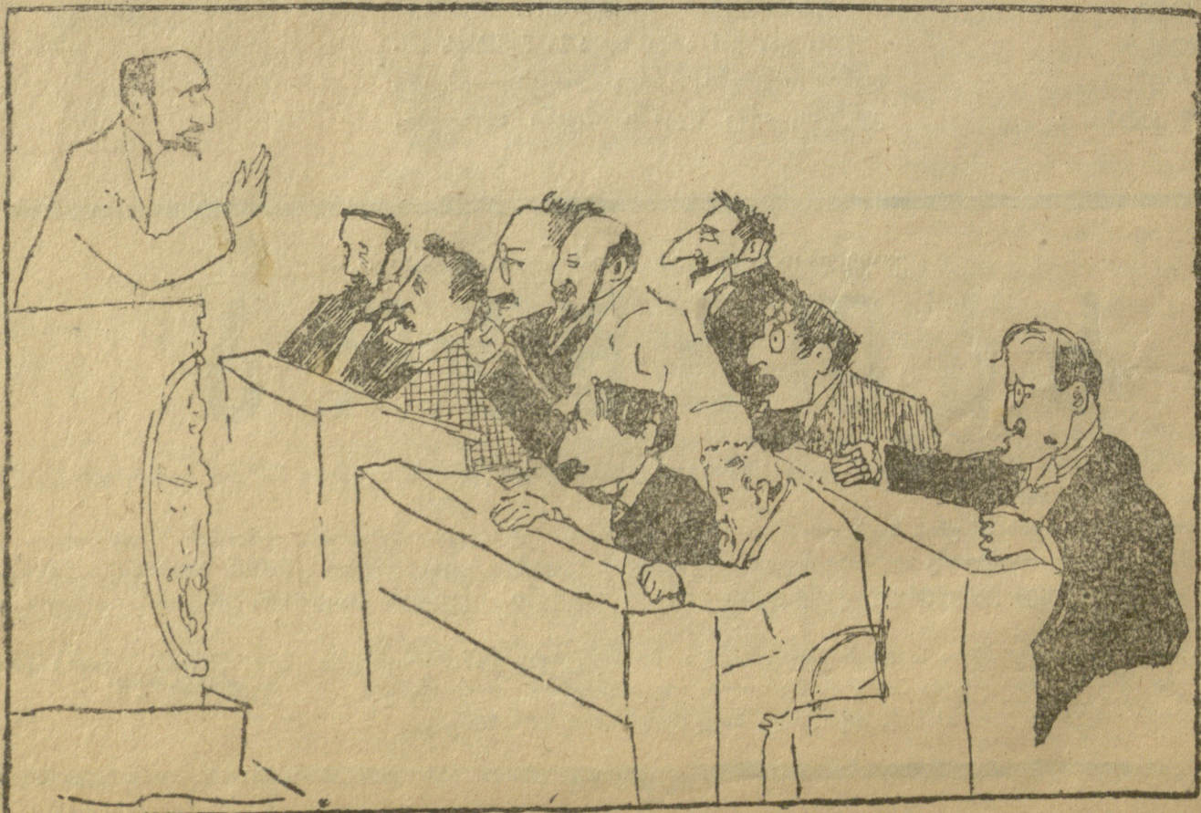
უკანასკნელი „ხათაბალა“ პარლამენტში.