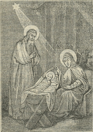
შობა იესო ქრისტესი.

შობამან შენმან ქრისტე ღმერთო, აღმოუბრწყინვა სოფელსა ნათელი მეცნიერებისა, რამეთუ რომელნი ვარსკვლავსა მსახურებენ, ვარსკვლავისაგან ისწავეს თაყვანისცემა შენი, მზეო სიმათლისაო, რომელი აღმობრწყინდი მაღლით აღმოსავლით, უფალო, დიდება შენდა.