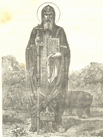
წმ. იოანნე ზედახსენილი

თან სალაპარაკოდ და მსმენელობა — თქვენი წმიდა ბრძანების ვასაგონად! ამის შემდეგ ქათალიკოსი ამ წმიდა ძმებოთურთ დაბრუნდა უკანვე ქალაქში და წაიყვანა ისინი ცხოველ მყოფელის და-მირონის გამომდინარე სვეტის ტაძარში. წმ. იოანნე თავისი მოწაფეებითურთ დაუარდა ცხოველს-მყოფელი სვეტის წინაშე, ვაოცებული ამ ღვთის მიერ ამაღლებულ სვეტის სასწაულთ. იგინი მადლობდნენ და აქებდნენ უფალსა, რომ ასე სიყვარულით მიიღეს ისინი. ამის შემდეგ ქათალიკოსმა სთხოვა მათ, რომ იგინი მასთან დარჩენილ-ყვნენ. წმ. იოანნემ და მისმა