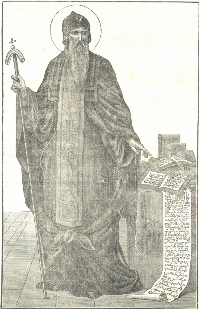
წმიდა და ნეტარი მამა გიორგი მთაწმინდელი.