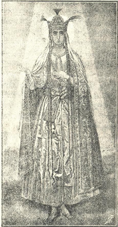
ქმ. დიდი მაწამე ქეთევანი

როსი. თუმცა ქართლის მეფე ლუარსაბ II და თეიმურაზი ნათესაები იყვნენ, მაგრამ რადგან აბბასი ძალას ატანდა, თეიმურაზი დაბრუნდა კახეთში, შე- ერთო ცოლად ლუარსაბის უფროსი ქალი, ხოლო უმცროსი და სპარსეთში გაუგზავნეს შაჰის. აბბასი დაწმუნებული იყო, რომ ორივე მეფეებისაგან უარს მიიღებდა, რადგან მისი მოთხოვნილება წინააღმდეგი იყო ქრისტეს სჯულისა და მხოლოდ მიზეზს ეძებდა, რომ ომი გამოეცხადებია ამ მეფეებისათვის, მაგრამ ლუარსაბ მეორეს და თეიმურაზს არ სურდათ თავისი ქვეყნის და ხალხის აოხრება და ამიტომაც შეასრულეს სპარსეთის მზაკვარი მეფის მოთხოვნილება და ამით შეაყენეს მისი განზრახვა. როცა ამ გზით იმედი გა- უცრუვდა აბბასს, მაშინ გაჰოცხადა, რომ მას სურდა