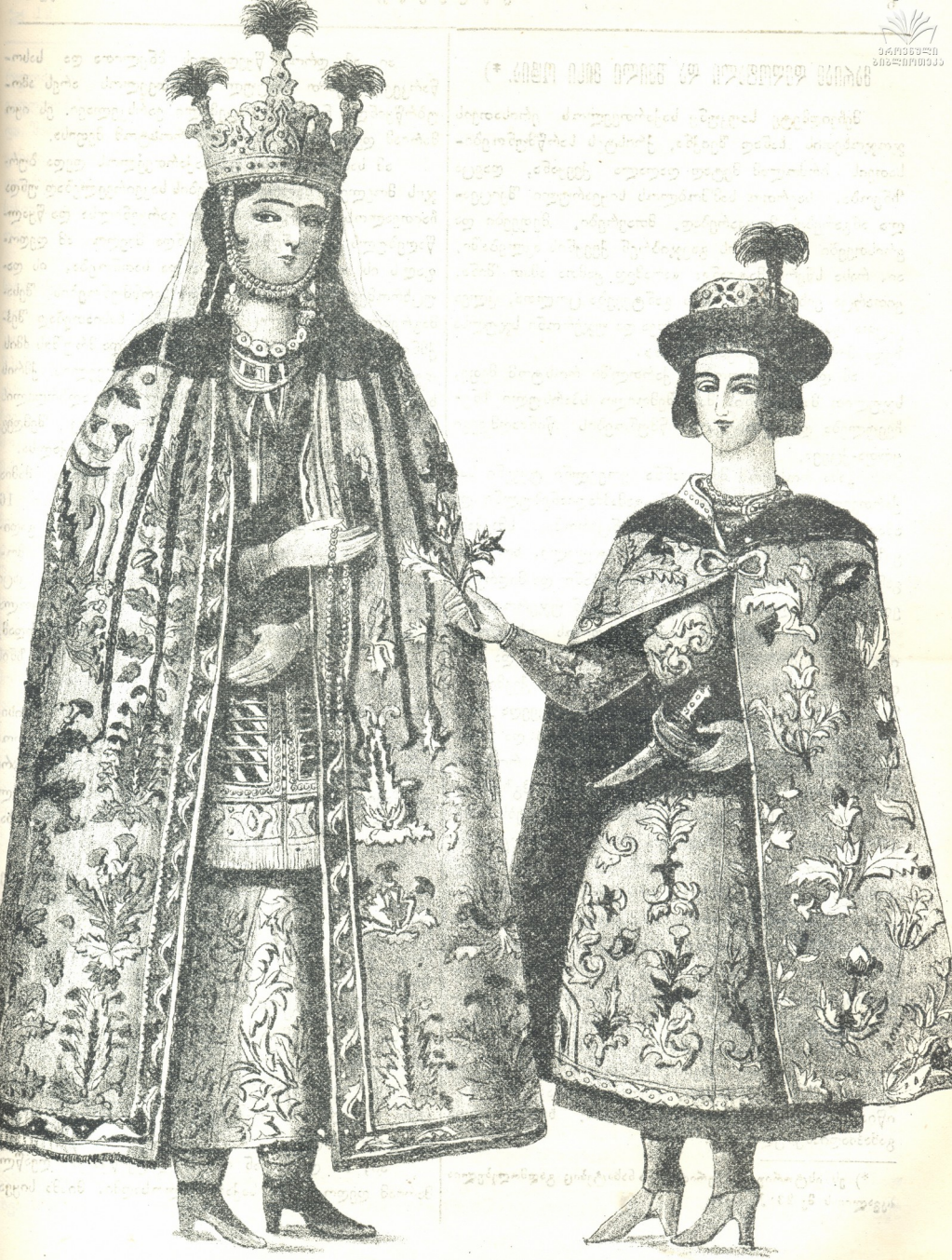
მარამ დედოფალი და შვილი მისი ოტაბ.