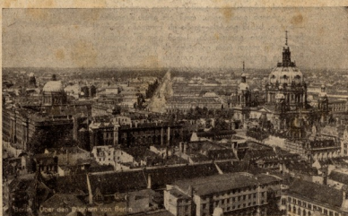
ბერლინი — საბერლინი ხედი.