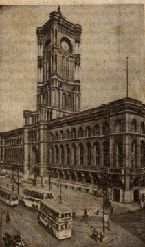
ბადავის მარტინელის სახლი...