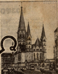
იშვარტორი მიღწევის ტაძარი...