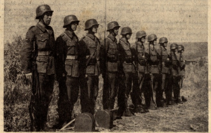
ბათუმი ლავიონი, მისა ლინიონაზა წასვლის წინ.