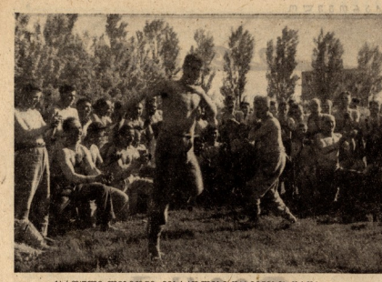
ქართული ლაზონი, მემკვიდრეობის მემკვიდრეობა.