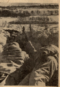
ჩინეთის მხრით. მიხეპარცხის ოპერაციაში.

ყოველივე ამის შედეგად შეძლება დავასკინო, რომ სტალინის შემოკრების ახალი კადრები და მათ შორის სტალინური მარშლის მარშალი ვასილევსკი არან ვასილევსკი და ვიროშნიკოვი, მარჩა მეტეხიონი, რომ დიდ ხანს შერჩის მათ ეს სახელი. ვასილევსკის შტეც აღბედა მალე ჩაქცენება, რადგან საბჭოთა კავშირში მარადული არავერთა — ყველაფერი მოძაბაბს, ყველაფერი იცლებება.