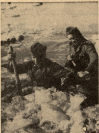
ბიზანდიელი ჯარისკაცები ამხმამი 306 პინუსს მდინარეში.