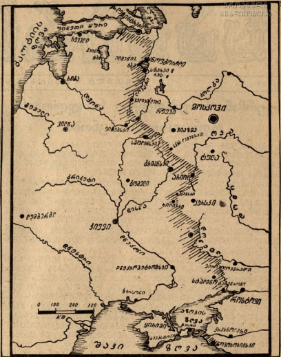
ფრონის ხაზი აღმოსავლეთის ფრონტზე.

აპრილის განმავლობაში გერმანიის საზღვაო ძალებს წარმატება გამოიხატება შემდეგი მანევრელებით: წყალქვეა ნავებმა ჩასივრეს 1 ავიონიდი, 1 კრისიტი, 8 საზღვაო განამადგურებელი. 1 წყალქვეა ნავი. ფლოტის სხვა ერთეულების შიერ განადგურებულია 8 საზღვაო განამადგურებელი და 7 წყალქვეა საცაბალო გემი, ავიონის შიერ ჩამოვარდა 2 წყალქვეა ნავი და 1 საცაბალო გემი. ამის ვარდა დაზიანებულია 8 საზღვაო განამადგურებელი. 11 წყალქვეა საცაბალო გემი, 1 წყალქვეა ნავების განამადგურებელი და 1 დამცველი გემი.