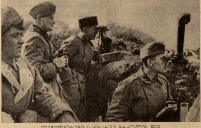
ლეონინიანი სანარაში ბარძლოს წიხ