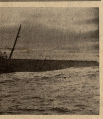
მხრის კილდვი ბრძოლი მამის ხალხის წმადინახება.

მიმდინარე წლის თანხის კამხანაში სტალინის მოუხდა უფასურული რეზერვები ვადებობისთვის ბრძოლის ველზე, მან ფორტზე მორტოკა შერბრეული ადამიანისთვის არბის ნაწილები და ცემბრის სე ვარგება. ეს ვარგებები ნახებუდა ვანადებურული არა და ბრძოლის უნარ დაკარგული არიან. ამეგვარად ვარსკეობის სტრახე ვაშლ ვუხვდა თავის მტრებზე და ფრეჩი ახლა კონტრანტრეული. ცუვეთი ჩვენებოდან რკინიგზა, რომ ამანახებ წიფელი არბის მიერ ფორტზე დანახი ნაწილები; ისინი უმთავრესად შეტყუებები მოხლებების და მალახარბლები არიან, რომლებიც 18 რეკვი ამ შესრულებიან. სახმელეთო ბატარეების, სახმელეთო დაწესებულებების, სანტარქული ნაწილების თითქმის მთლიანად ქალები არიან.