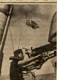
მტრის თვითმზარაფის მილოცნები

იქ, სადაე ინტელის-ამოცინის ფრონტებზე მოულოდნელი თავდასხმის შედეგად ნელა: მათ დაქანება დიდი დროს ცოცხელი ძაღა და ვეწინააღმდეგე სახეობის ვეწინააღმდეგე ვაღმოსავლეთი დასავლეთი, ვაღმოსავლეთი სამხედრო ჯარები.