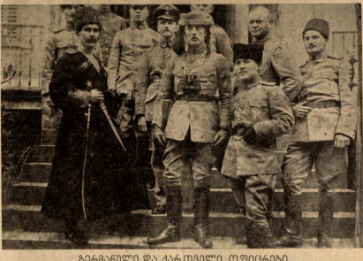
გერმანიული და პართვილი ოციტყობისათვის.

გერმანიული ოციტყობის შტაბი რომელიც მე ვინახებობდი ამ სურათის იტყობებდა. სასურველი ლეგიონის ჩა-