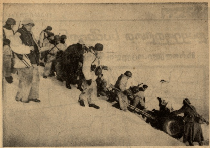
გერმანულთა მსხვერპლ არტილერია იკვლის კოშკივსს.