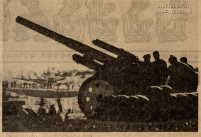
გერმანულთა მიმინე კამეხები აღმოსავლეთის ფრონტზე

გერმანიის მძიმე უწყებამ შეტევის სა-ავიაციო შენარჩუნება წინა დამით წარმდგომის მიზანებს იტრნო ინფლტრაციულ ცენტრზე მოიგონებ, ჩამოყარეს დიდი რაოდენობის ცეცხლოვანი იარაღი და ასაფეთქებელი უწყებები.