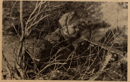
ბატიბურ მისვლინობაზე ჩატრულ ლეგონში

სისილის მშვილი სტალინი ბავშვებს მოერგებდა ბრძოლის ველზე.