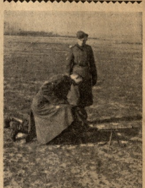
გარამანელი ოცეული ახსავა-ლის კაპიტოლ ლეგონისა ბატიბურამბეშიდან სროლას.

მეგობარ მე მინდა ნადებლად დამჩა ჩემი საშობლო და ხატრების თვა-ლი... ჩემთვის, ქართველი ციყვისთვის, ძენილა უფასუნდელად არ დავბე-ჩი თხადე და არ დავიმარბო იქ, ისევე ვმზობილად, ვაგზრდელ-ვარ და მირჩოლა ისარი, სხად მამა-პასა რეალუდის, იმართი უფიკობის...“ ბედს უნდა დამხორბლო ციყვი, ეტანობა, რომ იგი უფლები გა-ხავა. კიდევ დავიხიბ მოიხას ანდრეის უნდა გაიხისციოთ: „ქრია-სი შინა ვაგზარება ისე უნდა ვი-ციოკისა...“ გიბოვი და საწვალ-ფოდ გამოშეხევი ჩაიხივლით გა-წეობი, როგორც ვაგზორგმთელ-ობი, ვინაგვლები. ნახავისი უფავთ კარგად გიხრევიტ წარ-მატების ნიშნის განთავსებულებ-ისათვის ბრძოლში. მებრძოლი ქართველური საბა-მა. თქვენი მამ ს. 6—ძი. ლიბერტუკის პოსტალი, 26.3.43