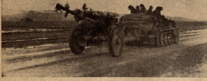
ამეხმინი — ციხელის ხაზისამდე

გაფიქრო შეყოფის ამის შერდეს სტოვებს შეყოფისურებს ახლდ პოზიციას შენდგეთ ამოცანით ქვეშის სახეობა ვალეურე სახმარისი მონეტლი სიციხელი სეკტორის ფარტლები. ვაგფიქრო შეყოფის დანარჩენ მებრძოლებთან ერთად ფარტლად გადავლით ახალ პოზიციას და ადგებო მორცე სახმარისო დამსვენს, რომელსაც ვაგზომოთ სასურველობით აგზარის ზურგში.