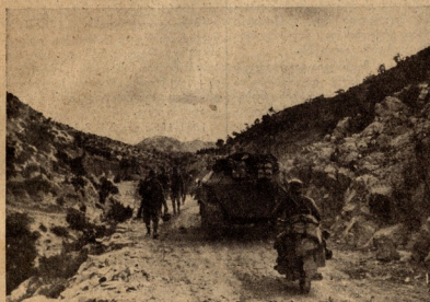
ალმოსკვლეთის ფორნტა იხმა ზამთარია. ბარგებზე მითხილ-აგამბთა ბატალიონი მიწის საბრძოლო პოზიციის შესასრულე-ლად — ბარგებზე ბანძო ალმოსკვლეთის ფორტის მართ-ვით სრულდებ — მოხალისე მარჯვენა ცხენოსანი მებრძოლი ფრ. — ტფისი. ბარგების ჯარის მოტრ-აწილები მიიღვენ ფორნტისა-ბე.