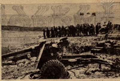
ბრძლის იმეხლისმუსა ნანდაზმბაზუსუ ჰამეხისი.

სახი დღის წინაღუდს ლინენგრადის სამხრეთ-აღმოსავლეთით დაწყებული მხარეთ შეტეგანი საბჭოთა ჯარისა შეტეგა აგრძელდა არმიის მძლავრ დარტყმასა და მტერი უკუდებოდა იქნა დღის წინააღმდეგ და განადგურებოდა. სამხრეთ და შუა ბუნისში ამერიკისა და ინგლისის მხატვით მხედრობა მძლავრ აწარმოებს შეტეგის იბალიის პოზიციების წინააღმდეგ. გრძელდება მძლავრობა ჩრდილო და სამხრეთში იმე შეტეგისა. რაიფიც ხმელეთზე იმე შეტეგისა.