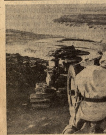
ლომდეთან. ბირამანდუსა მსხუზამი არბოლოჩისის პოზიციისა.

აჯანყება მიმდინარეობს წარმადებით. ბოლო რიც სოციალისტ ბოლშევიკური განხორციელები განადგურებულია. თავიერი სამხრეთით და აღმოსავლეთით ბოლო რაიონში აჯანყდენილი ბოლშევიკებისაა. ირანის ჯარის ნაწილები ეწინააღმდეგება რათა ხელმძღვანელ ვალაქშინი ამერიკის წინააღმდეგ.