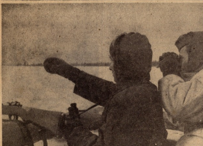
ფრონტისამდნ სახმადრის საპარაველითა და სხრასათ-სანემკაბით.— წყალქვეშა ნაბიზის ბაჰანაღზობაზელი ბაზი ფორაქულს ზედაზელი.— ბირსინაელთა შინიზულთი ტანსაფინაალადგომი მხე-ბიზი ტხინისი ფრონტთა.— მხეპარკი რცაქელის მითარს ზაბიონ-ბს დაზგამიზის შუღზაბიზს.