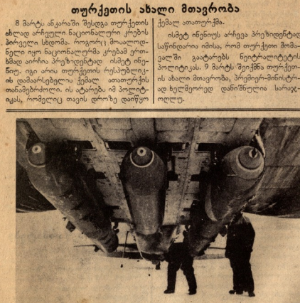
გამაგინის ჯარის ნაწილები მოგადაგაბისათვის სულათითა ვიზრინავებ. სულათით ნაშენების თიშირეზინიანი, აკოვლასაც ჩაბაძ უხანათის ჩაგონასვხაბა. — ალფონსავლეთის

გოლიდამეე დოს მტოვ წინააღმდე-გობის შემდეგ ტველ დაწებდნენ ჩინ-ეთისნაწილებსგერეკულ ვეხა-ვე-ნა და ლინპანა. ამ ნაროდ ტვეთა რი-კის, ჩავრდელი შანდენში აღწეეს 70.000 ჯარისკაცი.