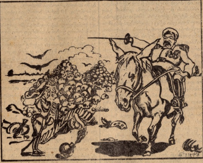
ხელში აიღო მხალი და გირი შეესაკმა აპირი. თვის მამულს აფრთვებენ „გენერალურ“ მარშალსი.

საკვლავილი გადავქალით ჩვენი რიგების ერთიანობა სამშობლოს თავისუფლებისათვის ბრძოლაში. მამულ ევგადი-რეგენტი ჩვენი საველე საფრთხეები ერთგულები დროში. და ეს დროში შეიფრთხის უახლოესი ხალხის. გაცის ერთგულები ახალი თავისუფლების სამშობლისათვის, მშობლი სოხიდარობისათვის.