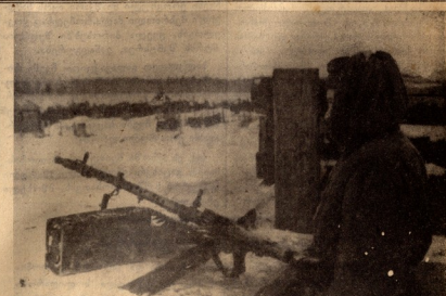
და სასწავლებელი გამოქვეყნდნენ პარანა საბრძანსკორტო თეთი-ბეგონი მოგაგრობის ბაშ ტრავალინის ფორცინა. სასაბაზრო ტომა-ვარონი. ერთ-ერთი მოწინავე ცეცხლის ნურტილი.