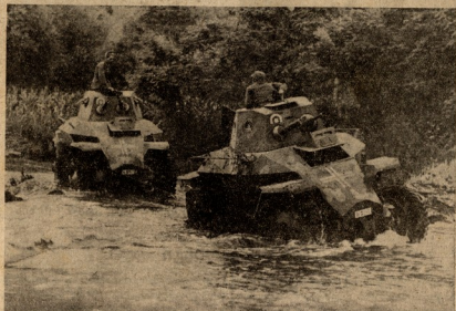
ბრძანებულთა უკვე აღკვეთილი გახვითი.