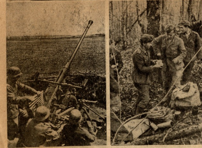
გაჩაძანეთა ტანჯაი ბაღსაკალთისი ფრონტზე. — უნაჩაძე მოცემავაჟიბი ბაჩაძანულ ჯარისკაცებთან. აბაი ნაციონალისტები. — გაჩაძანეთა სახმობო ბატალიონ ბარის მოღოფინში. — სპაძვისი მიღება კაპაძისის ფრონტზე.