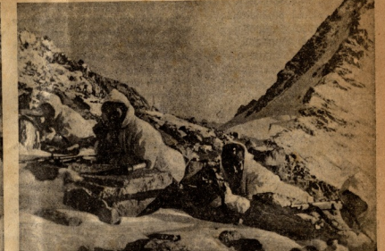
ის ფრონტში. მა რუკენის; ციხისლის ხაზზე გამასპირის მთაში, მარცხენი: მითხილავებო საბოლოო სახარელო ამო-ბანის შესარულების წინ.