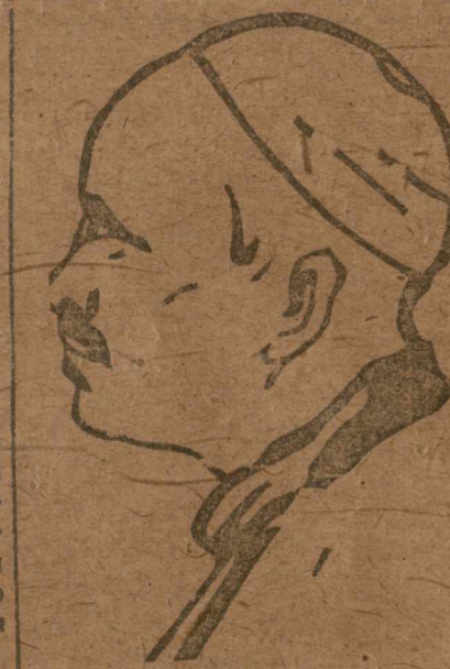
Манад-Огли Нухинский уезд.

В Геокчае силами ком'униста удалось провести в не-