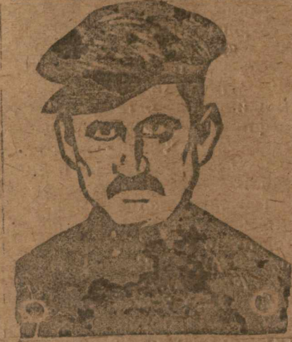
Шифор Шихалиев Шемахинский уезд.

Засеяно в Шамхорском уезде очень мало полей вследствие