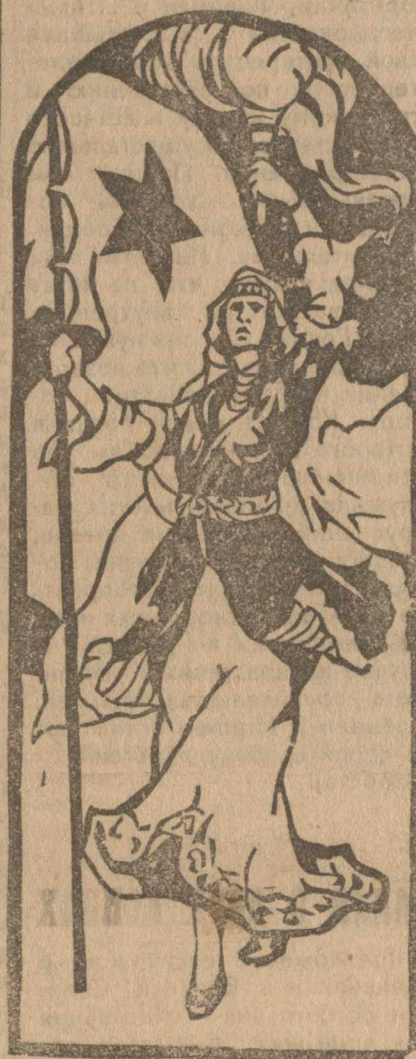
Да здравствует Красная Армения!