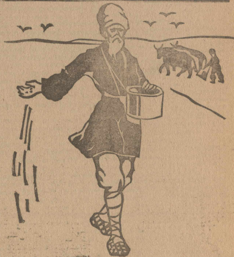
Побольше площади засева — И нам разруха не страшна!

Французская армия отступила в Киликии (Малая Азия) к Средиземному морю вследствие восстания мусульман.