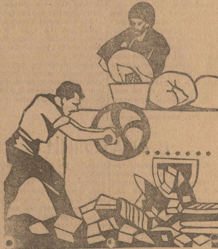
Союз города и деревни — залог победы над хозяйствен. разоружением.

Французский министр-президент Лейг заявил представителю газеты «Маленький Парижанин», что надеется при содействии парламента добиться точного исполнения Германией версальского договора, переустройства национальной организации труда и повышения производительности во Франции.