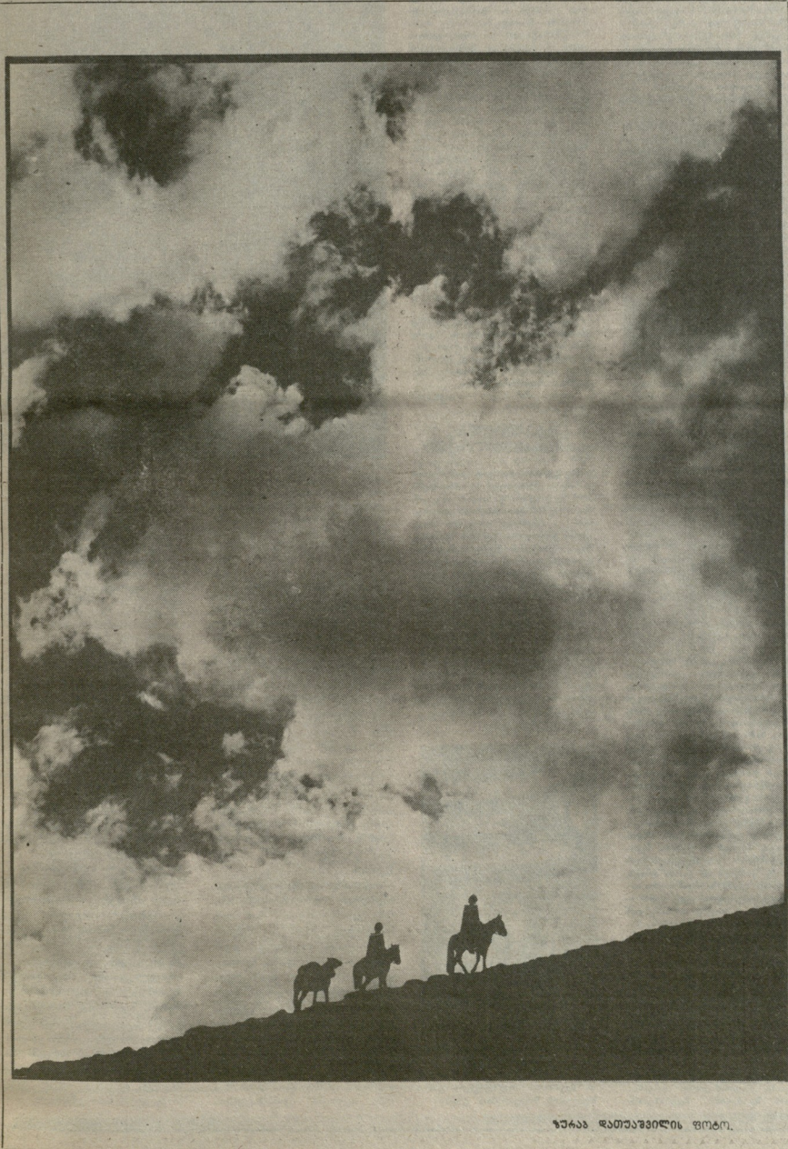
ზარა დათვასილის ფოტო.