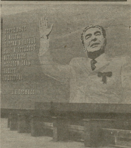
მურმან ჩანაპას ფიქორი

სოციალისტური სკელონი: დანა წინკარპო პენსიონერი, იტარება თავის ცარიელ ნიხთან და ფიქრობს — ნიხა, მათხილიან უკვე დატვირდილი, თუ რა არც წიქსულარი?