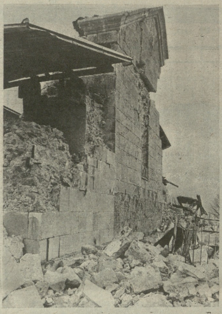
შერადკალის კვლდის. 23 აპრილი

კიდევ ერთხელ დაბატდა უბედურება ჩვენს კიდევ ერთხელ შექმნილი და შეპირებული სტიქიისა და ამაღლადი რაიონების მოსახლეობა. არადა, თითქმის იგი იშუაზედა ამ იმის წილს წინ დღეობდებით შექმნილ კრიზისებს რჩევები კაც, ბოლოდროინდელი ამდისიმცემი ცდომულებით გულგამაგრებულ სსიპებშია და რწენით შეუბერება მომავალს. 23 აპრილს არსებულმა წყევამ ბრძენიდან შეზარაზა ჩვენს გამძვინვარებულს ბუნებამ კიდევ ერთხელ დაანია ღრმა, ახალ-მოსავარი კალი ჩრველია ცნობიერებს.