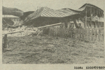
აპაბა ნაგებობის სოფლი