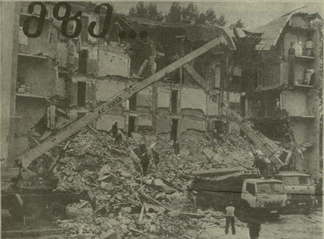
საქართველოს მფარველთა კავშირის მიწისძვრისა და დაზარალებულთა დახმარების კომისიისაგან