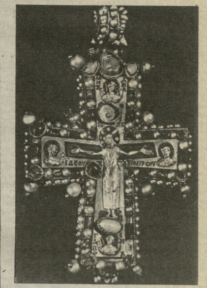
იესუ კაცთ-მოსაზარაო, განაწმინდეთ ჩვენს პორობისაგან და წილად უნდა განვახადოთ ჩვენს რაბთა დანაშაბის ჩვენ შორის სული წილად. სათოლ მგალოვადი

ყველაფერი ისე უბრალოდ თქვა, როგორც ღმერთმა.