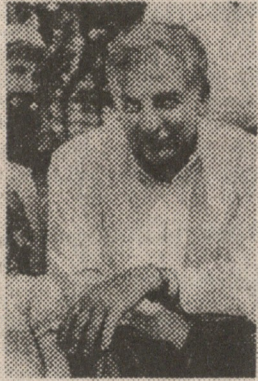
მეექვსე თავი სახელმწიფო