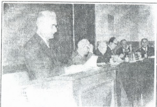
25-26 დეკემბერი, 1965 წ.

უნივერსიტეტში რაღაც „ქარიშხლის“ მსგავსი მსვლელობა; პროფ. აკაკი შანიძეს ყოველი მხრიდან უტყუდუნ, განსაკუთრებით იმის გამო, რომ იგი იყო დიდი ივანე ჯავახიშვილის ღირსეული დამფასებელი და თაყვანისმცემელიც. ყოველივე ამას ემატებოდა ჩემი ოჯახური მდგომარეობა: თბილისში უბინაობა, რაჭაში უსახსროდ მიტოვებული დედა, დები და სხვა.