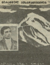
რადაც - პირა ვთქვი.