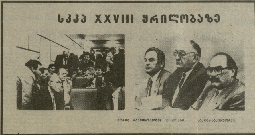
იოსებ ღვინჯიანი, ვახტანგ გომიანი, სააკაშვილი