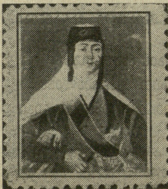
საქართველოს უკანასკნელი დედოფალი მარიაჰმი

ნიც განუწყვეტლად თვით ნებროთიდან მიმდინარეობენ. რაც უნდა სარწმუნო იყოს ადგილობრივ მეფეთა ასეთი უძველესი დროის შთამომავლობა, მაინც ამ პროვინციების წარსული, ზღაპარს წააგავს და ისტორია მრავალს ზღაპრულს და გამოურკვეველ რას-