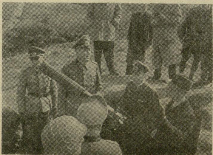
ფრანგი უზრუნველყოფის ქართ. ლეგიონერებთან