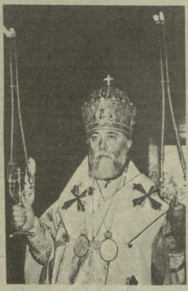
არწახელი დღევანდელი ღონე მდგობისა იმ საბაბით. თითქოს მათ დაღუბეს საქართველო.

ის კი გვაფიქვდება, რომ XIX-XX საუკუნეებში ჩვენი ერის ცხოვრება- ში მომხდარი ფაქტები შედგები იყო სწორედ ქართველი სულიერი ღონის დაკნინებისა. სულმოკლეობისა. ურთიერთმტრობისა... და რომ წინა- პარათა ეს ნაკლი ჩვენშიცაა; ჩვენც მოინანი ვართ ამ სიმდაბლისა. თავი კი უკოდველი გვეგონია საკითხები ისიცაა, მათ ღვთისა განა ჩვენ უკე- თისნი ვინებდით? გავუძლებდით კი იმ წლებს სიმძიმეს?