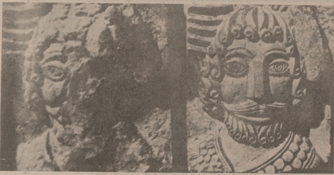
წარმომადგენლის რედაქციის დეპუტატი, ნ. შანიშვილის რედაქტორული.

„მართლმადიდებელი“ მიხედვით, სტეფანოს ერისმთავრის შემდეგ ქართლის ერისმთავარი გახდა ადარნასე — მაშინ კისარმა მოაწყო და ძესა ბაქურისა, ქართველთა მეფისა, ნათესავსა დაჩისასა, ვახტანგის ძისასა, რომელი ერისთავი იყო, რომელსა ერეკლე ადარნასე და მისცა ტფილისი და მთავრობდა ქართლს“ (VII ს. პირველი ნახევარი).