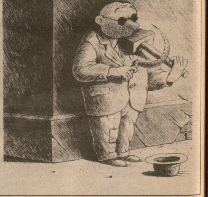
ფრანგული გაზეთი „მონდი“ იმდენად გაკვირვანია მთელს მსოფლიოში, რომ აქ დაბეჭდილი ეს მრავალმეტყველი კარიკატურა, რომელსაც ასახავს დასავლური პრესის ნაწილის ანგაზინდელ მიდგომას საბჭოთა კავშირისადმი, უფრო დიდ მნიშვნელობას იძენს, ვიდრე ამ საკითხზე დაბეჭდილი სტატიები უცხოეთის ბევრ სხვა გამოცემაში.