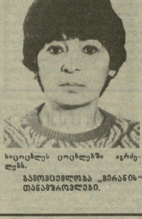
ბაგოტოვკის ბარამიძის თინა გურდული.

სიხი, ზენ შერაცხა და ატეხდა მისი ხალხი დღიდან... მისი თარიშვილი და მრავალი სხვა. მისი თარიშვილი და მრავალი სხვა.