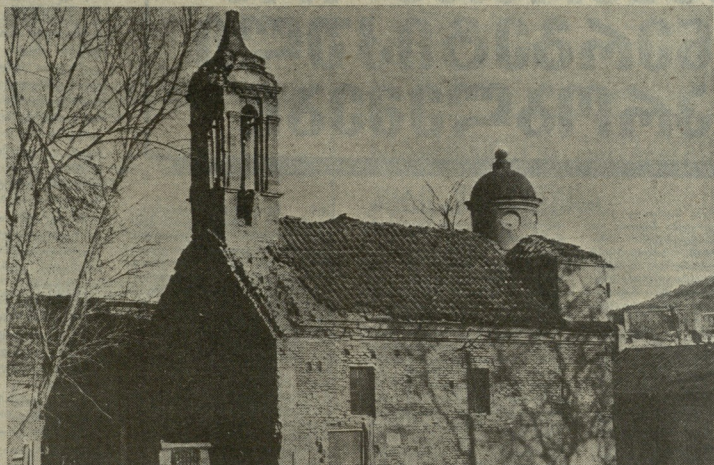
ქველი თბილისი — დარჯან დავითის ძის კლასი