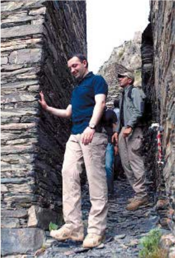
„კიდევაც დაიზრდებიან ალგეთს ლეკვები მგლისანი!“