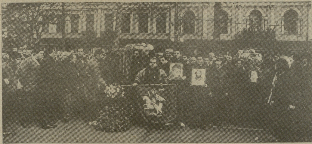
სს „საქართველო“ ფოტოგრაფია.

მინილ კიკვაძის ფოტოგრაფია. სს „საქართველო“ ფოტოგრაფია.