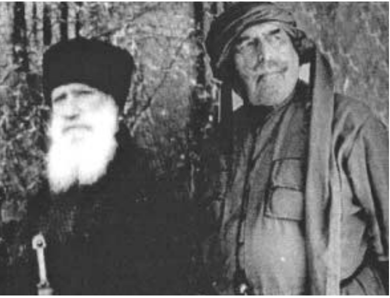
ბატონი ოთარი საკითხს ისე

„დასაბამიდან იყო სიტყვა და სიტყვა იყო ღმერთისა თანა და სიტყვა იყო ღმერთი“, გვასწავლის ბიბლია. ხოლო, გოეთე უკვდავ „ფაუსტში“ ერთგვარად გადასინჯავს ამ სწავლებას: თავდაპირველად იყო საქმეო, იტყვის იგი და საზოგადოებისთვის მუხლჩაუხრელ შრომას მიანიჭებს უპირატესობას.