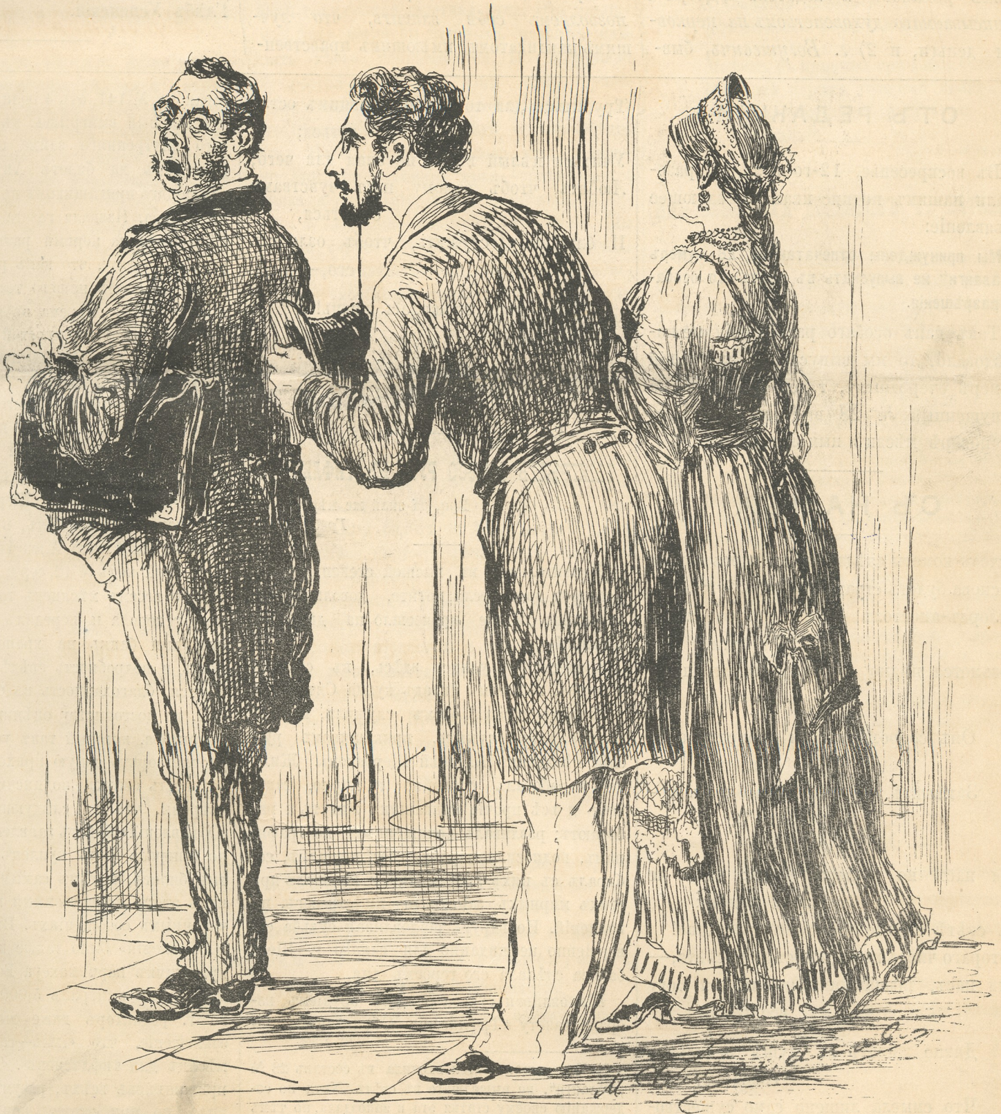
— Позвольте пройти! — Куда лѣзешь?