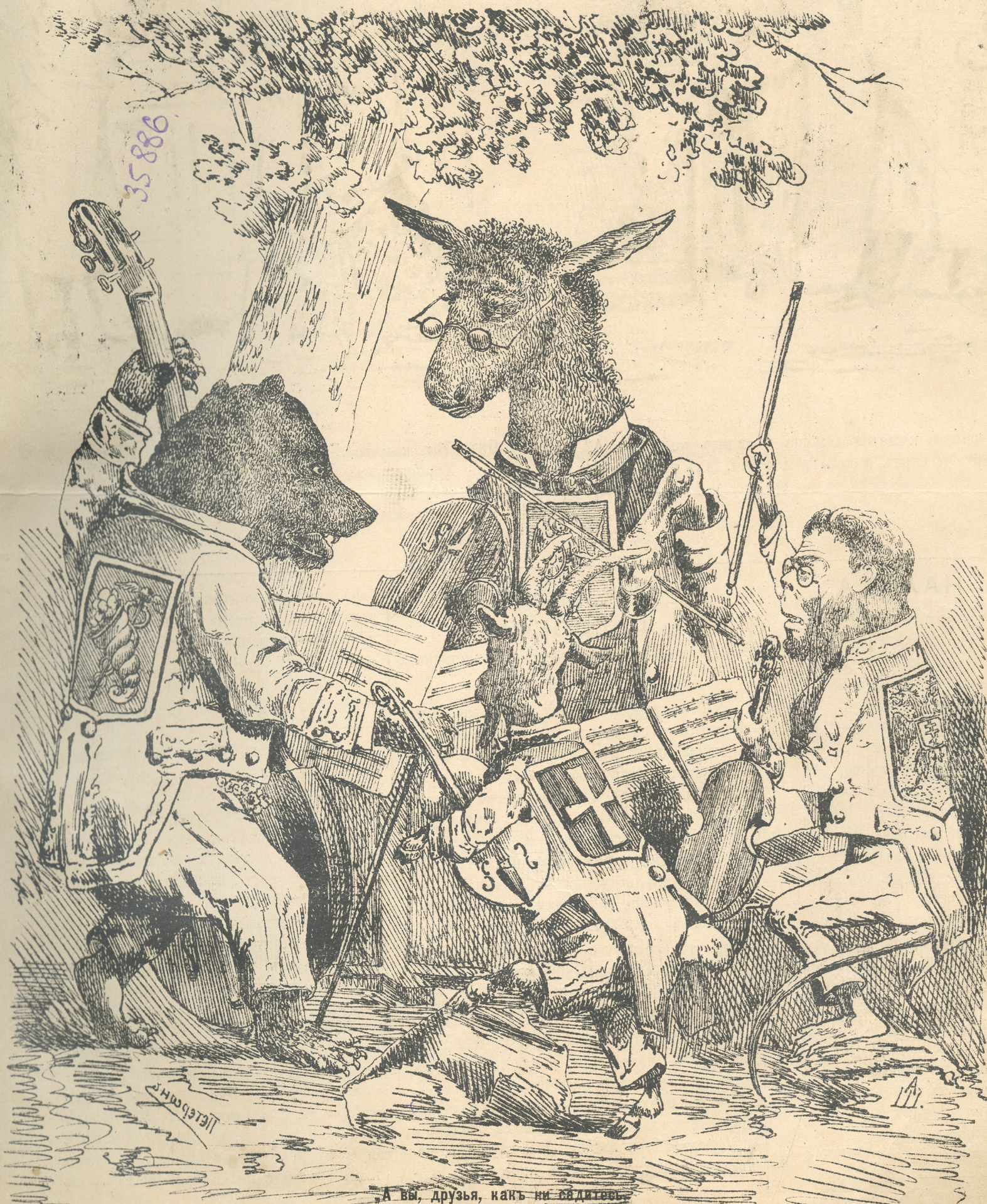
„А вы, друзья, какъ ни садитесь, Всѣ вы музыканты изъ головы!“

КУДЖЕСТВЕННО-ЮМОРИСТИЧЕСКІЙ ЖУРНАЛЪ. ЕЖЕНЕДѢЛЬНОЕ ИЗДАНИЕ.