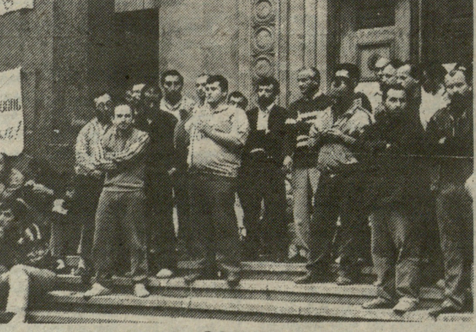
ყოფილი „იმელის“ შენობის წინ.

დების სხვადასხვა მხარეს მდგარად მიიანებებს — ქართველებს — ალარაფერი დაგორჩა საერთო: აღარც სისხლი, აღარც გენი, აღარც გული... არადა ეს გული ხომ ყველას ისევე ერთი საერთო მიზნისთვის გვიძვრის — საქართველოს დამოუკიდებლობისთვის, მაშ, რა გვემართება დღეს და პატარას, უფლებიანს თუ უუფლებოს?.. როდის მოვალთ გონს?.. აი, კითხვები, რომლებიც დღესვე მოითხოვს პასუხს, რადგან ზეალ გვიან იქნება ოპერატიული ინფორმაცია: გუშინ დედაქალაქის რამდენიმე