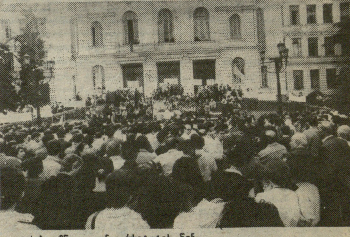
სახელმწიფო უნივერსიტეტის წინ.