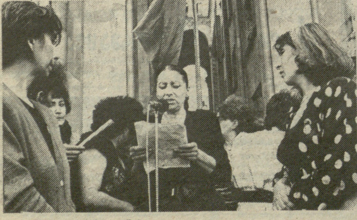
მთავრობის სახლის წინ.