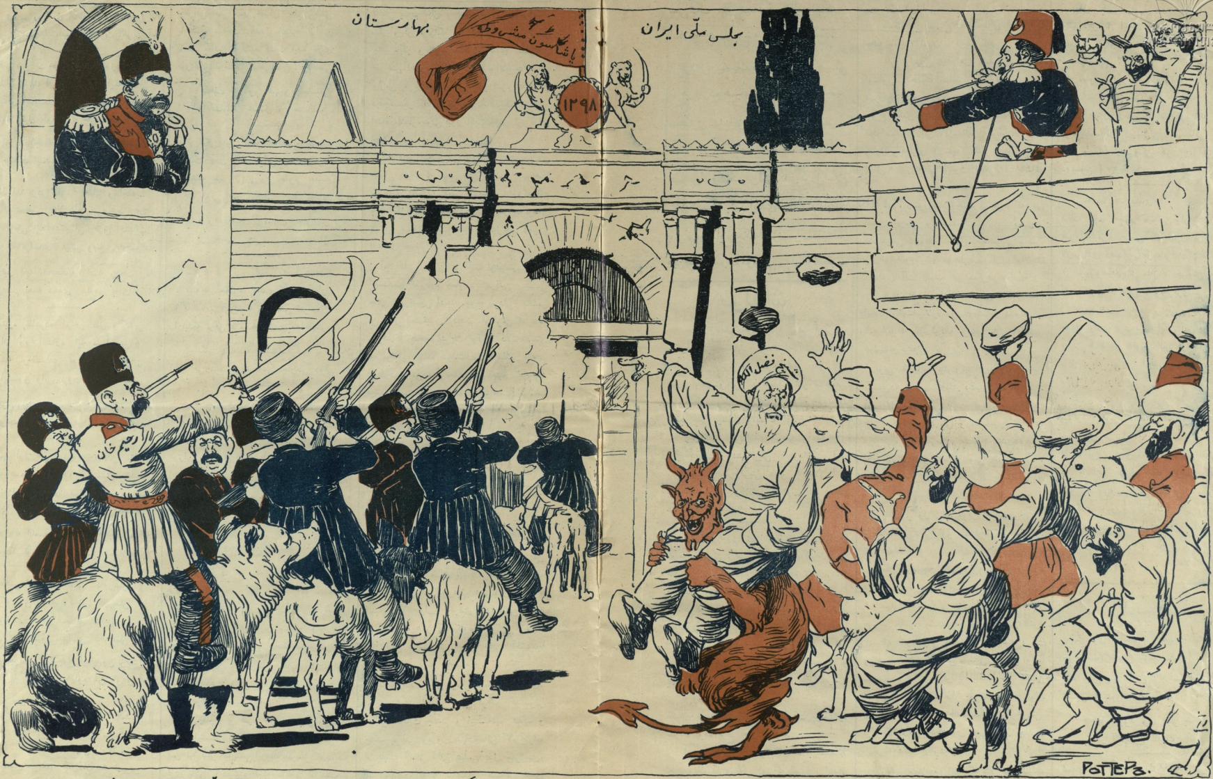
مختلف انسان کورورم فورقگرام . لیک بو قور نمازلق ایله دوغروسو ملاي خان ن کورورم فورقگرام . بی سبب تورقگرام وجهی وار « مجلس هی پوزغون کورورم فورقگرام ، ملتی جاهل کورورم تورقگرام ..... »