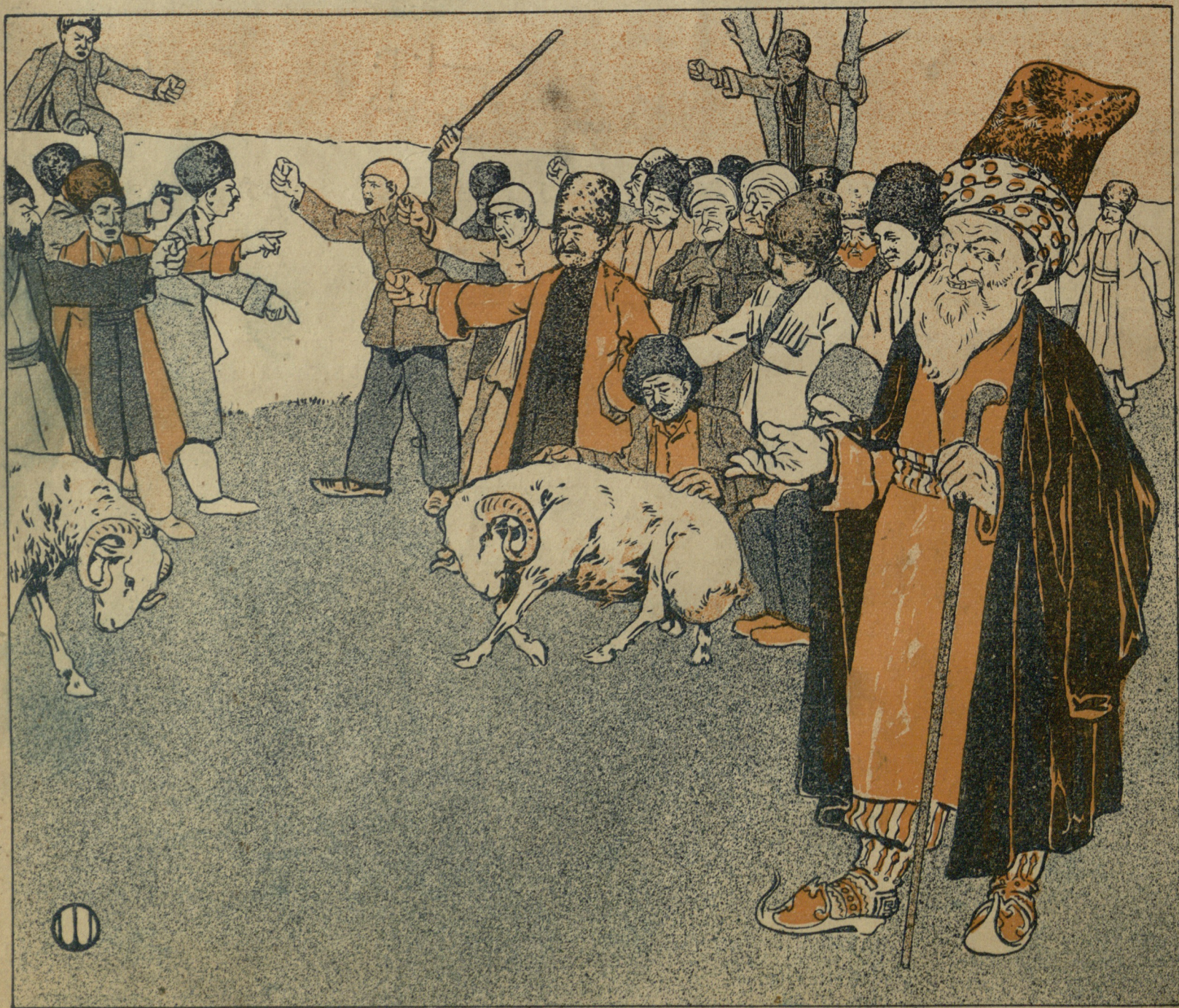
Лит. С. Бызова Тифлисъ