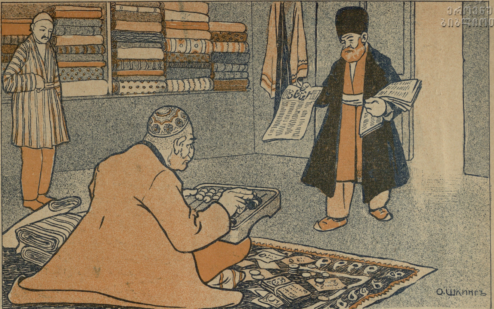
— ბი ' ბოგონ გლობ დემორი ჰაჯი გაზიტ ალ აოხი . صبا حده انشا الله گلوب ديبه جکسن حاجي دور گيت اور وس اول