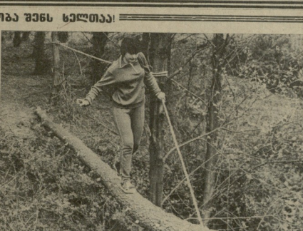
შენი ჯანმრთელობა უნეს ხელთა!