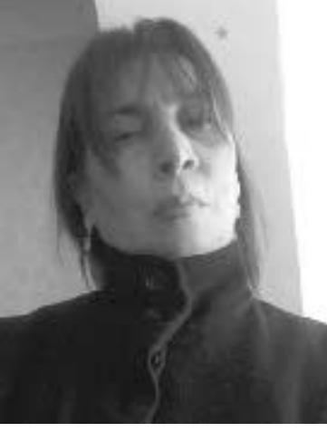
(დასასრული. დასაწყისი იხ. „სგ“ N13)