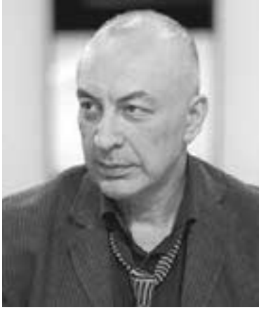
არა სისოსხლა, არა სიკვდილი, არამედ რაღაც სხვა!

— არა სიკვდილი, არა სიკვდილი, არამედ რაღაც სხვა! — თქვა გრანელმა.