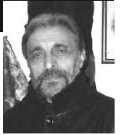
თქმს, ყველა კუთხეს, ყველა ქალაქს — მივალთ და ვეტყვი... ეს ასე იქნება და „აქციენტების“ დროც დასრულდება!

გვარამიებისა და მისთანათა კენტავრულ-მაზონისტური ბაკანალიები უნდა დამთავრდეს!